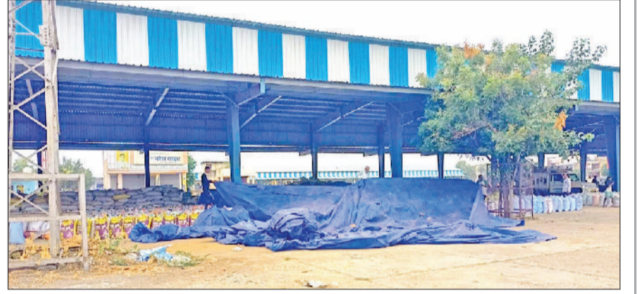
मंडी अटेली। अनाज मंडी में तिरपाल से ढकी बाजरे की ढेरियां।

सोमवार को दिनभर हुई बरसात से जहां किसानों को राहत मिलने की संभावना बनी है, वहीं शहर एवं गाँवों क्षेत्र में अनेक जगहों पर पानी भरने से लोगों की परेशानियां भी बढ़ी हैं। शहर में जल निकासी के पुख्ता इंतजाम नहीं होने से महेन्द्रगढ़ में कई जगहों पर पानी भर गया। जगह-जगह पानी भरने से लोगों को राहगीरों को परेशानी हो गई। बरसात में दुकानदारों की दुकानदारी भी प्रभावित हो गई। रेहड़ी एवं खोचका लगाकर सामान बेचने वालों को भी कमाई से हाथ धोना पड़ गया।