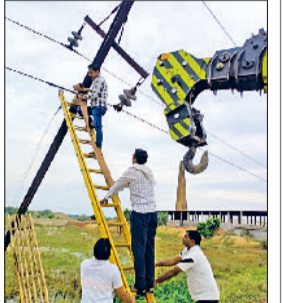
भिवानी। तेज अंधड़ की वजह से टूटे हुए बिजली के पोल।