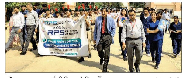
महेन्द्रगढ़। जागरूकता रैली निकालते विद्यार्थी।