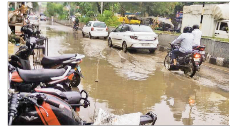
महेन्द्रगढ़। आईटीआई मार्ग पर भरा बरसात का पानी।

ऐसी बरसात नहीं हुई थी। इस दौरान मौसम अधिकांशतया साफ-सुथरा रहा और जिन किसानों को बाजरे की लावणी समय पर नहीं कर पाने की चिंता सता रही थी, उनकी परेशानियां काफी हद तक दूर हो गई थी। उसके बाद से करीब डेढ़ महीना के अंतराल उपरांत आज सोमवार को ही मौसम ने पलटी खाई है तथा पहले रिमझिम एवं बाद में अच्छी बरसात हुई है। इस बरसात से मौसम ने भी कर्वट बदली है। पहले जहां दिन के समय तेज धूप खिलने से मौसम थोड़ी गर्मी को बना हुआ था, वहीं सोमवार को यही दोपहर का मौसम एकदम से बदल गया और इसमें ठंड घुल गई।