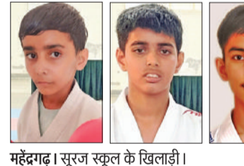
महेन्द्रगढ़। सूरज स्कूल के खिलाड़ी।

58वीं हरियाणा स्टेट स्कूल कराटे खेल प्रतियोगिता में सूरज स्कूल के विद्यार्थियों ने लहरया परचम