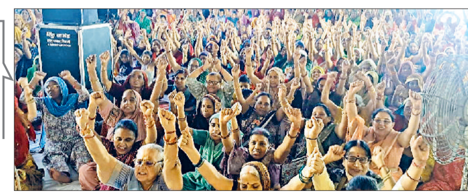
भिवानी। हाथ उठाकर श्रीराम के जीवन से शिक्षा लेकर चलने का आह्वान करते श्रद्धालु।