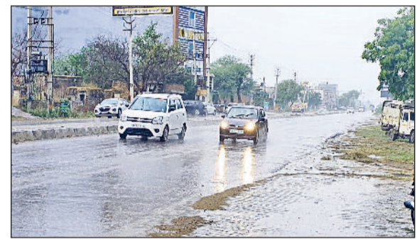
भिवानी। बारिश के बीच गंतव्य की ओर जाते वाहन चालक।

एकदम बदले मौसम के मिजाज ने हर किसी के लिए परेशानी खड़ी कर दी। हलकी बूंदबांदी के साथ आए तेज अंधड़ ने पूरी व्यवस्था की कमर तोड़ दी। खेतों में धान व कपास की फसल का बिछौना हो गया। वहीं पेड़ों के टूटकर बिजली की लाइनों पर गिरने से पूरी तरह से बिजली की सप्लाई की कमर टूट गई। बवानीखेड़ा के इलाके में करीब 13