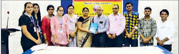
भिवानी। अतिथि को स्मृति चिन्ह भेंट करते शिक्षक।

उन्होंने अपने खेतों में फसलों में सिंचाई के लिए सौर ऊर्जा की प्लेटें लगाई हुई थी तथा बीती रात्रि अचानक आई तेज हवा ने उनके अरमानों पर पानी फेर दिया। उसके चलते उन्हें लाखों रुपए का नुकसान उठाना पड़ा।